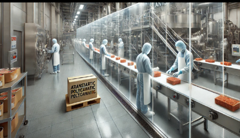
Policarbonato antiestático en centro de manipulación y embalaje