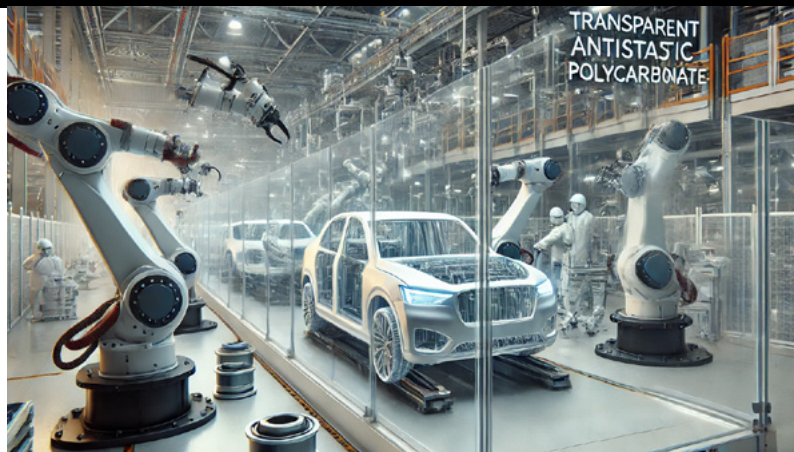
Policarbonato antiestático aplicado centro de ensamblaje automotriz