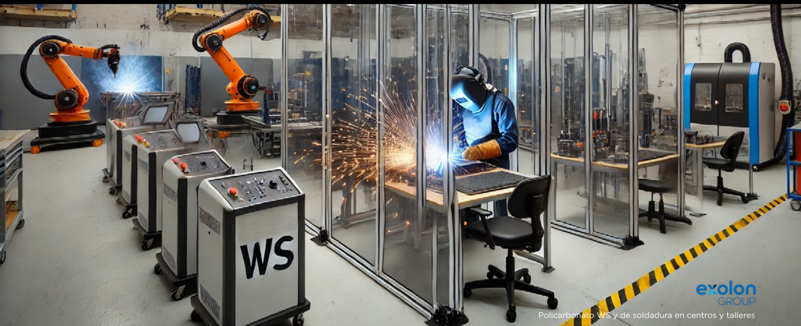
Policarbonato WS y de soldadura en centros y talleres