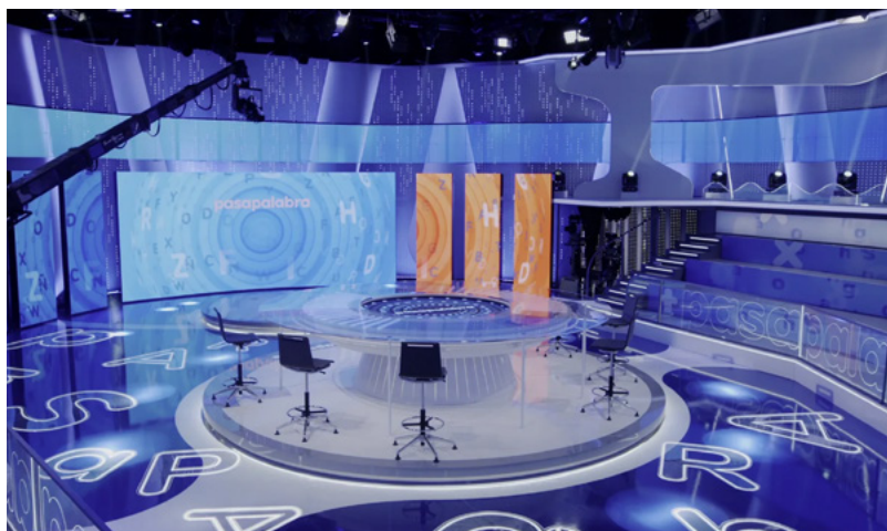
Policarbonato antiestático aplicado en Plató de TV

✦ Otras aplicaciones: Estudios de grabación y producción audiovisual, Plató de TV, salas de servidores y centros de datos, salas limpias, Joyerías, museos, entre otros.