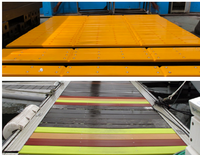
Tarimas y suelos navales de polietileno PE 300