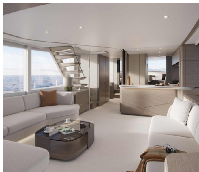
Vista interior de embacación con ventanas de metacrilato