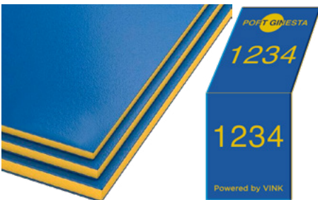
Placas e identificación de puertos en HDPE Bicolor Marino