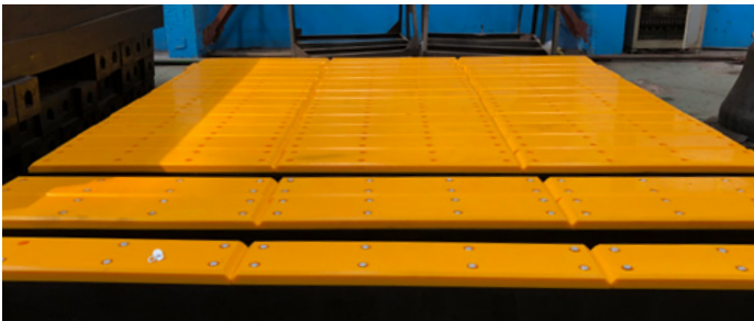
Plataformas de HDPE Marino