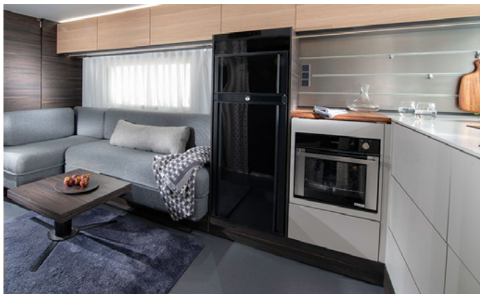
Interior de embarcación con equipamiento y diseño Solid Surface y Composite