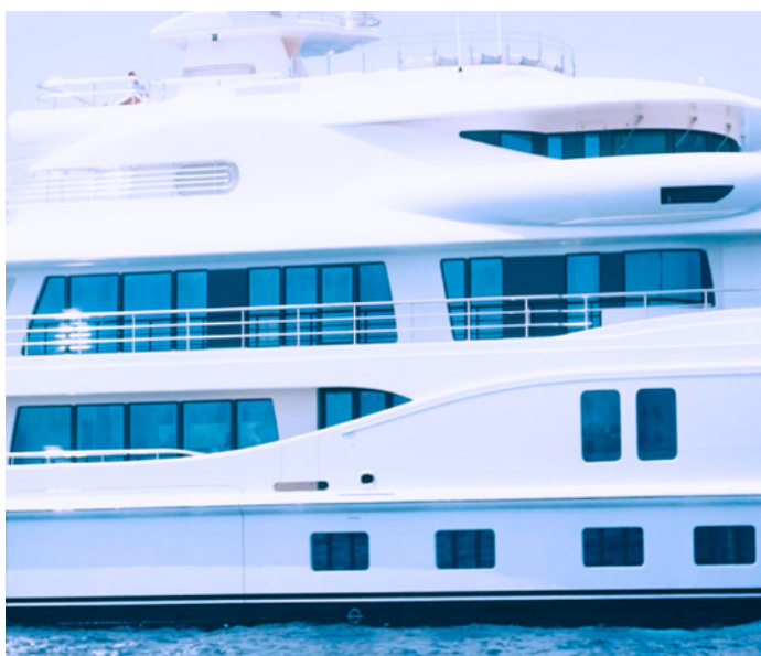
Ventanas y escotillas de barco con policarbonato compacto UV