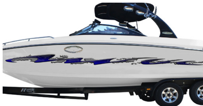
Rotulación de embarcación en vinilo marino