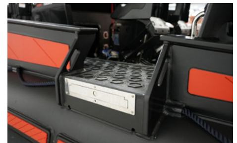
Suelo y plataforma en HDPE Marino