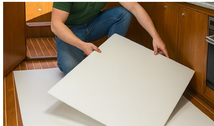
Instalación PP Alveolar para protección en barco de recreo