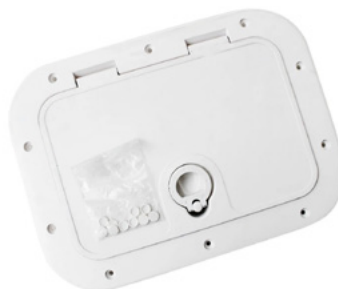
Cubierta de HDPE Marino blanco