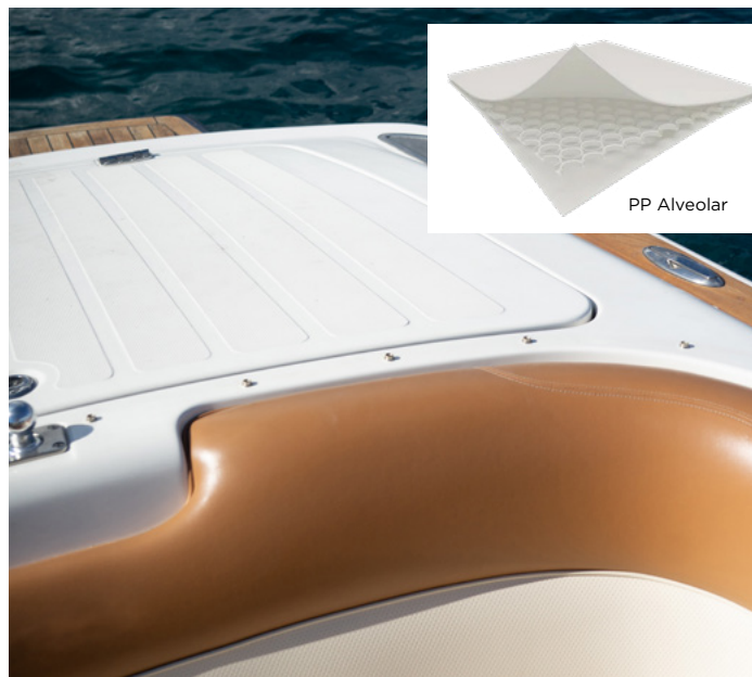
PP Alveolar para embarcaciones

Ensayos de reacción al fuego de productos de construcción. Parte 2: Ignición por impacto directo de la llama.