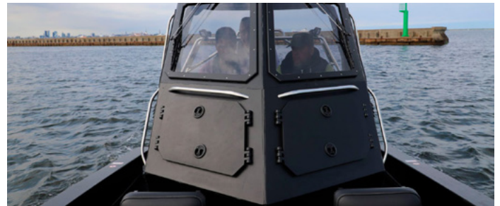
Embarcación fabricada con HDPE Marino